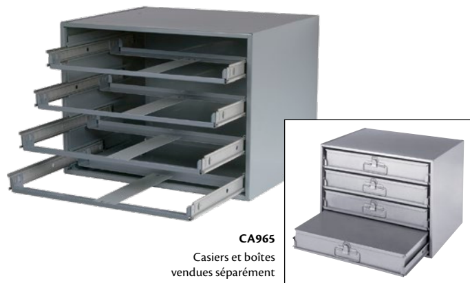
CA965 Casiers et boîtes vendues séparément